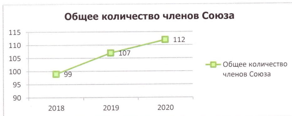
Диаграмма 1. Общее количество членов Союза.

По состоянию на 31.12.2020 года количество членов Союза составило 112 организаций, из которых 106 организаций зарегистрированы в Тюменской области, 6 организаций имеют юридический адрес в других субъектах РФ (ХМАО, ЯНАО, Свердловская и Омская областях).