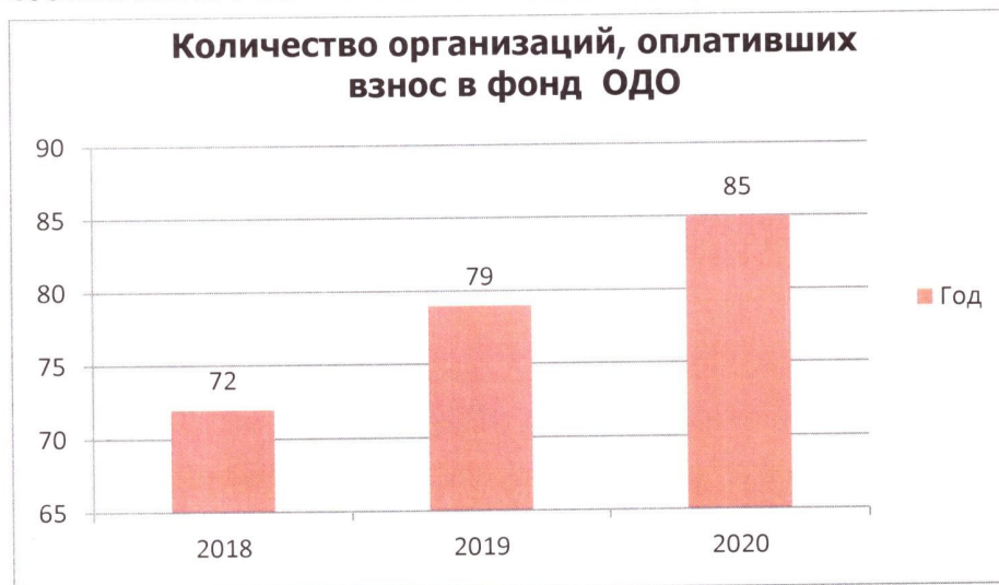
Диаграмма 3. Количество организаций, оплативших взнос в фонд ОДО.

Право принимать участие в заключение договоров подряда на выполнение проектной документации с использованием конкурентных способов , в соответствии с ФЗ-44 и ФЗ-223 имеют 85 организаций.