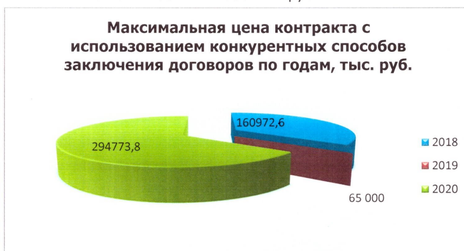
Диаграмма 4. Максимальная цена контракта с использованием конкурентных способов заключения договоров по годам, тыс. руб.

– В 2020 году зафиксирована максимальная цена контракта без использования конкурентных способов заключения договоров – 65 млн. руб., при этом максимальный объем составил 502 млн. 441 тыс. руб. Максимальная цена контракта с использованием конкурентных способов заключения договоров составила – 294 млн. 773 тыс. руб., при этом максимальный объем составил 301 млн. 366 тыс. руб.